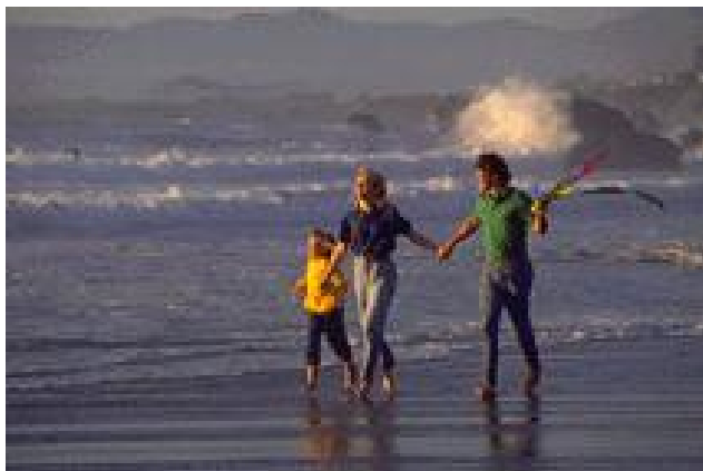
Bijschrift bij afbeelding.

Ook kunt u lezers eraan herinneren om een terugkerend evenement in hun agenda te zetten, zoals een lunch voor aandeelhouders op elke derde dinsdag van de maand of een halfjaarlijkse veiling voor een goed doel.