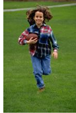
Bijschrift bij afbeelding.