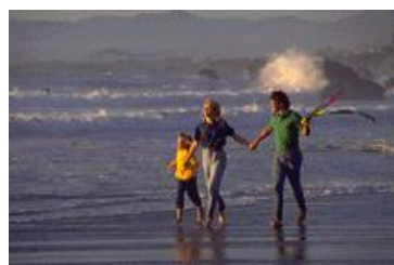
Bijschrift bij afbeelding.

vlakbij het artikel en het bijschrift van de afbeelding vlakbij de afbeelding.