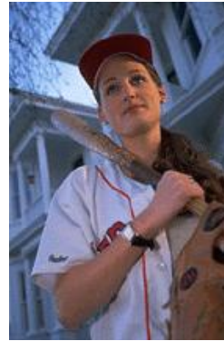
Bijschrift bij afbeelding.

Een groot gedeelte van de inhoud van de nieuwsbrief kunt u ook gebruiken voor uw website. Met Microsoft Publisher kunt u op eenvoudige wijze de nieuwsbrief converteren naar een website. Deze kunt u vervolgens op het World Wide Web publiceren.