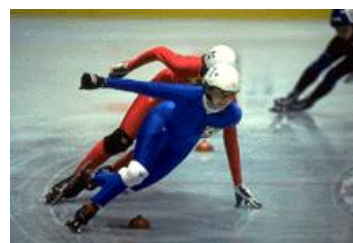
Bijschrift bij afbeelding.

Plaats de afbeelding die u hebt gekozen vlakbij het artikel en